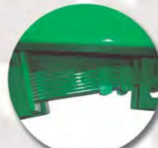
AMORTIGUACIÓN LANZA BALLESTA SPRUNG DRAWBAR