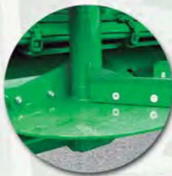
BANDEJA DE PLATOS Y PALAS ALTAS SHEET WITH PLATES AND HIGH BLADES