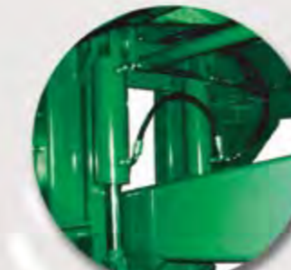
AMORTIGUACIÓN LANZA HIDRÁULICA DRAWBAR WITH HYDRAULIC SUSPENSION