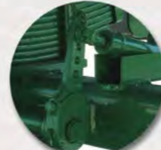
LEVAS REGULABLES ADJUSTABLE CAMS