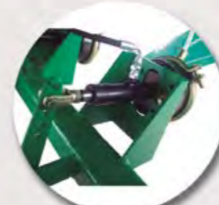
FRENO MIXTO MIXED BRAKE