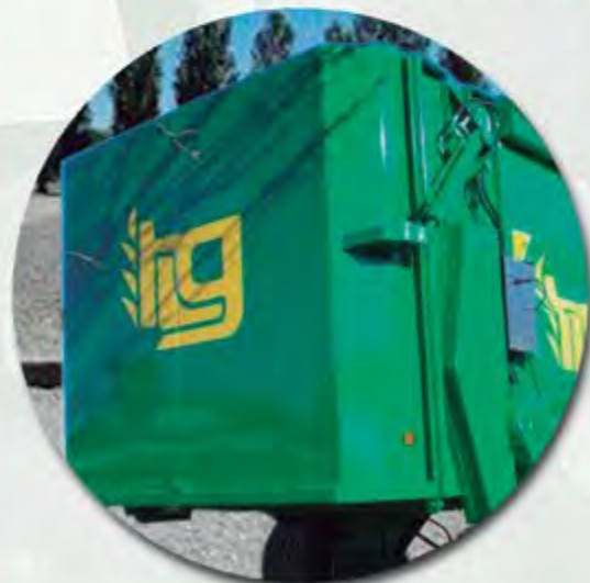
LIMITADOR COMPLETO DE ESPARCIDO COMPLETE LIMITER OF SPREADING