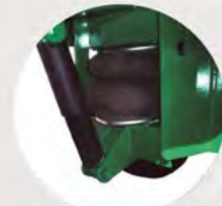
AMORTIGUACIÓN LANZA NEUMÁTICA SPRUNG PNEUMATIC DRAWBAR