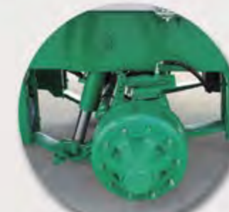
SUSPENSIÓN HIDRÁULICA HYDRAULIC SUSPENSION