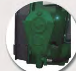
REDUCTOR Y MOTOR HIDRÁULICO REDUCER AND HYDRAULIC MOTOR