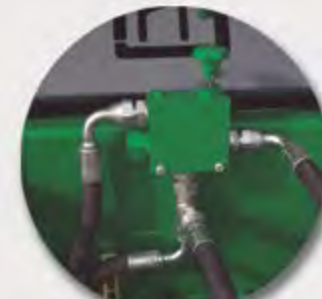
REGULADOR HIDRÁULICO HYDRAULIC REGULATOR