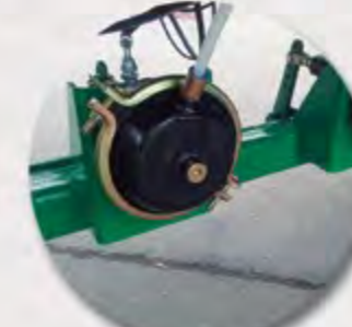
FRENO NEUMATICO AIR BRAKE