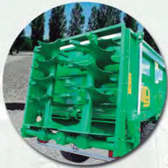
GRUPO DE 2 RULOS GROUP OF 2 AUGER BEATERS