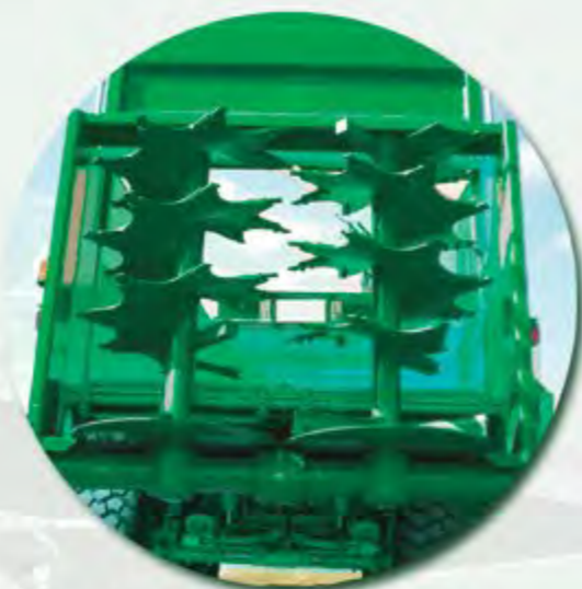
GRUPO DE 2 RULOS 1000 RPM GROUP OF 2 AUGER BEATERS 1000RPM