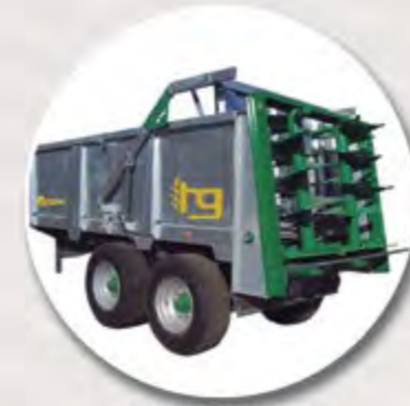
CAJA GALBANIZADA GALVANIZED BOX