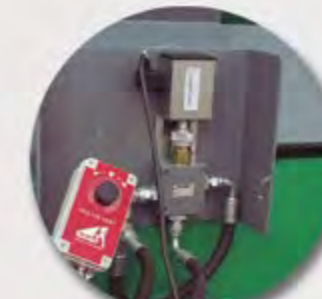
REGULADOR ELÉCTRICO ELECTRICAL REGULATOR