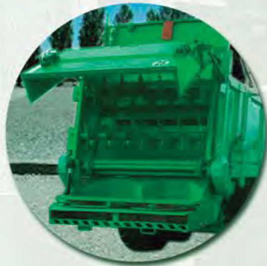
GRUPO ESPECIAL COMPOST 2 RULOS HORIZONTALES + 2 PLATOS SPECIAL GROUP FOR COMPOST 2 HORIZONTAL AUGER BEATERS AND 2 PLATES