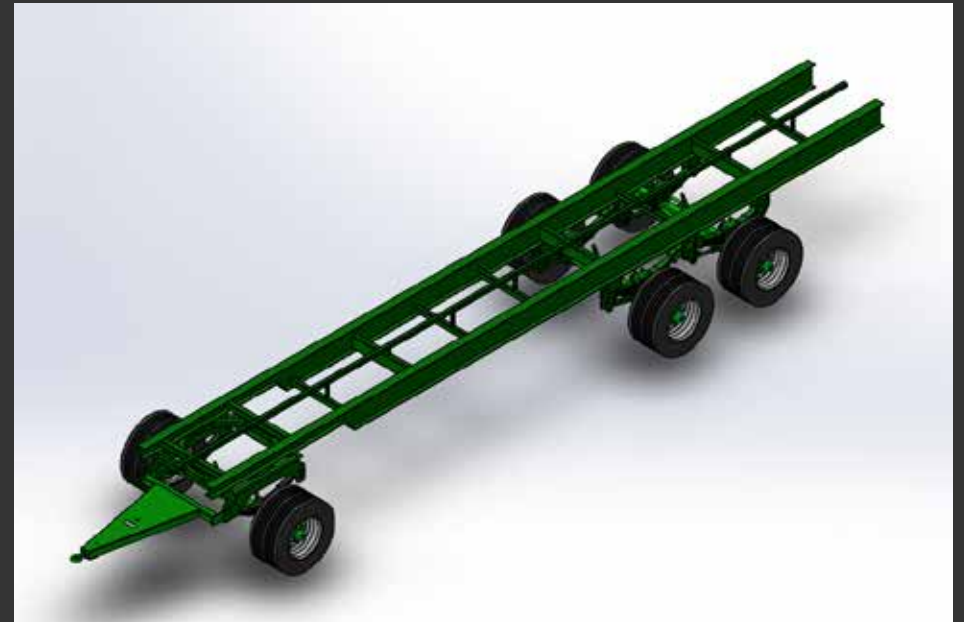
3 ejes giratorio ST52 3 essieux tourelle avant HEB+DT