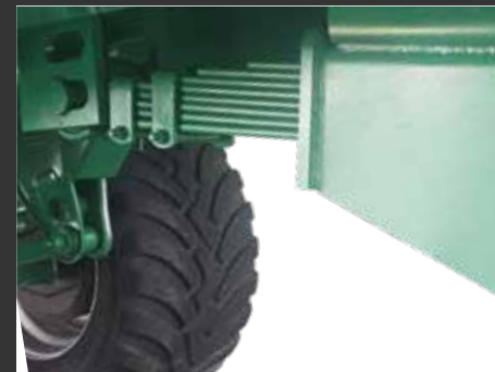
Amortiguación con ballesta en lanza Flèche à ressorts