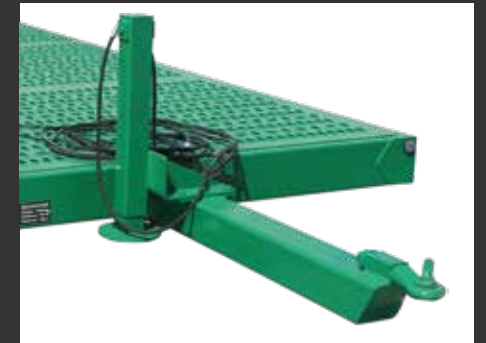
Apoyo hidráulico D.E. Béquille hydraulique D.E.