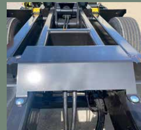
Cierre hidráulico contenedor // Fermeture hydraulique du conteneur