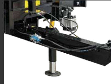
Apoyo hidráulico con bomba manual Béquille hydraulique avec pompe manuelle