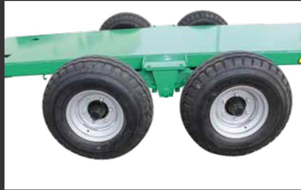
2 ballestas boggie Boggie 2 ressorts