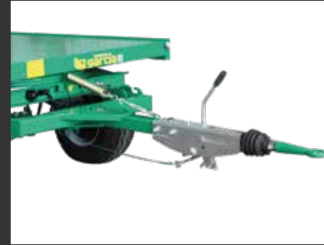
Freno de inercia Frein à inertie