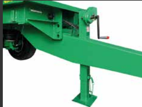
Apoyo manual 2 velocidades Béquille manuelle 2 vitesses