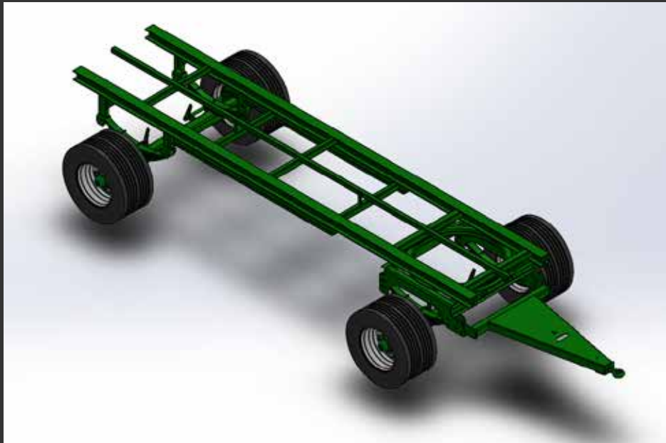
2 ejes giratorio HEB+DT 2 essieux tourelle avant HEB+DT