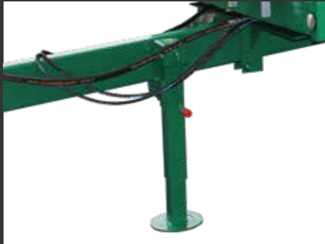
Apoyo manual extraíble Béquille manuelle extractible