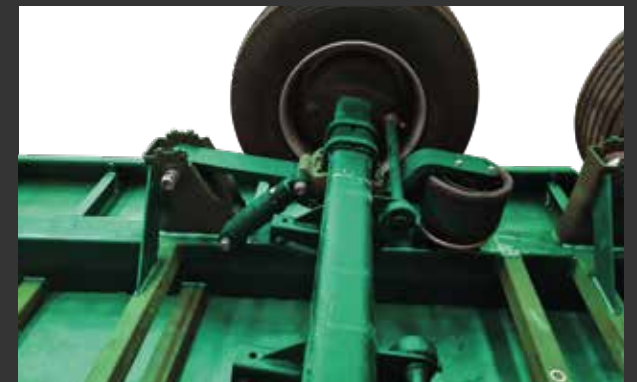
Neumática Suspension pneumatique