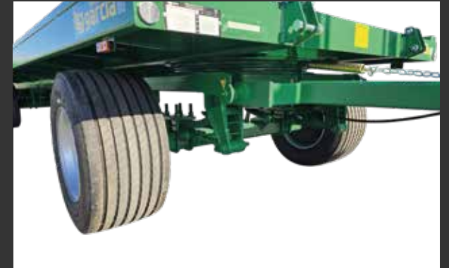
1º eje ballestas con tensores (3-4 ejes) 1er essieu à lames avec tenseurs (3-4 essieux)