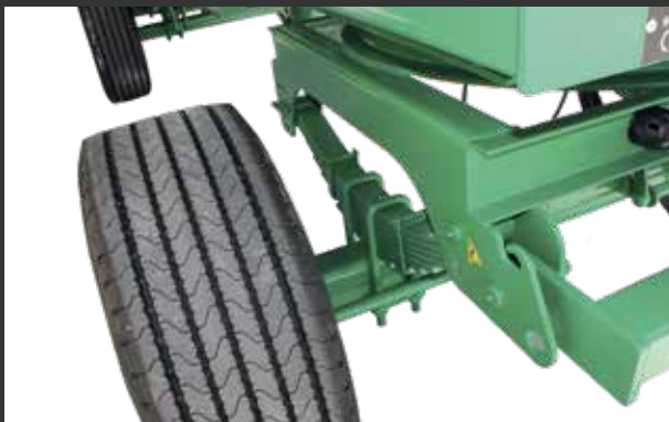
2 ejes giratorio 2 essieux tourelle avant