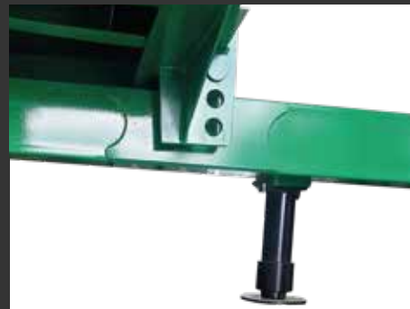
Amortiguación con elastómero de goma Amortissement silentblock dans la flèche