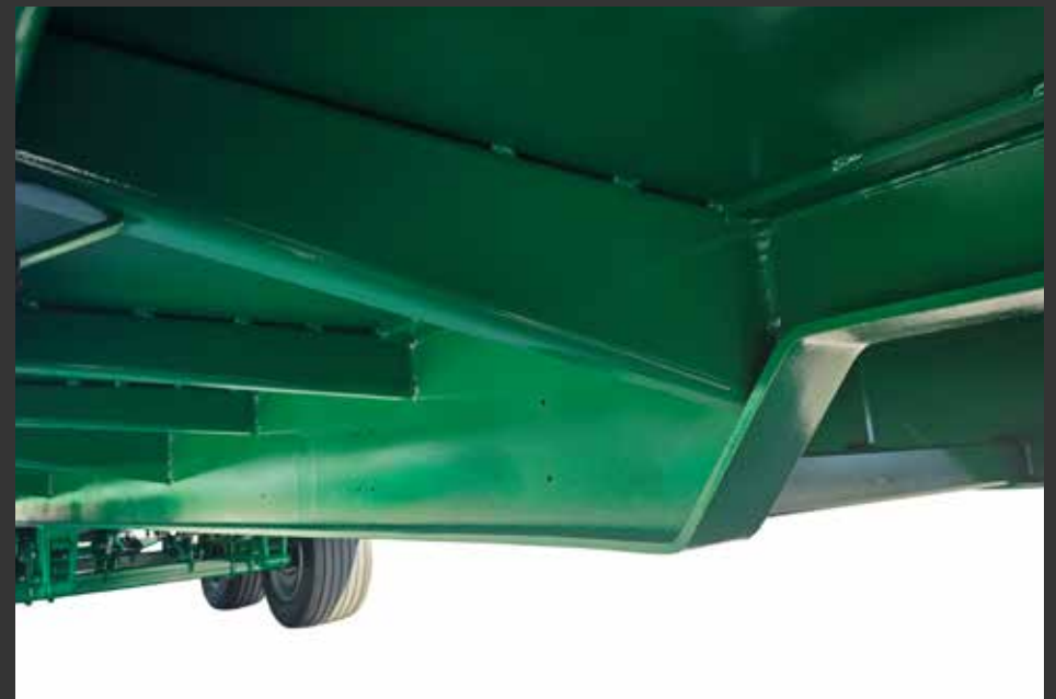
Acero ST52 120x12-6 CHÂSSIS ST-52