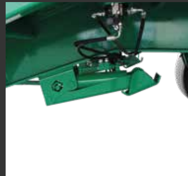
Apoyo hidráulico plegable Béquille hydraulique pliant