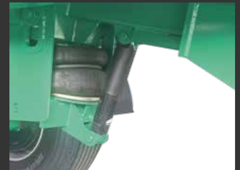
Amortiguación neumática en lanza Flèche avec amortissement pneumatique