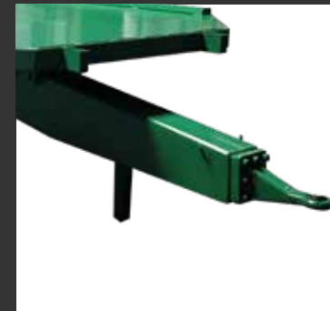
Anilla atornillada Anneau boulonné