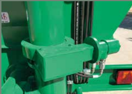
Detalle giro de tubo hidráulico / Détail de la torsion du tube hydraulique