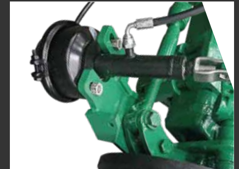
Freno Mixto Frein mixte