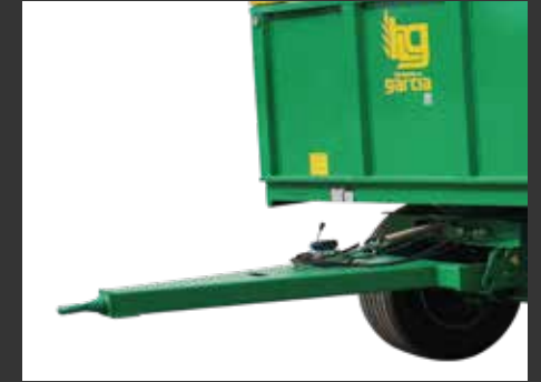
Muelle regulable en altura Ressort réglable en hauteur