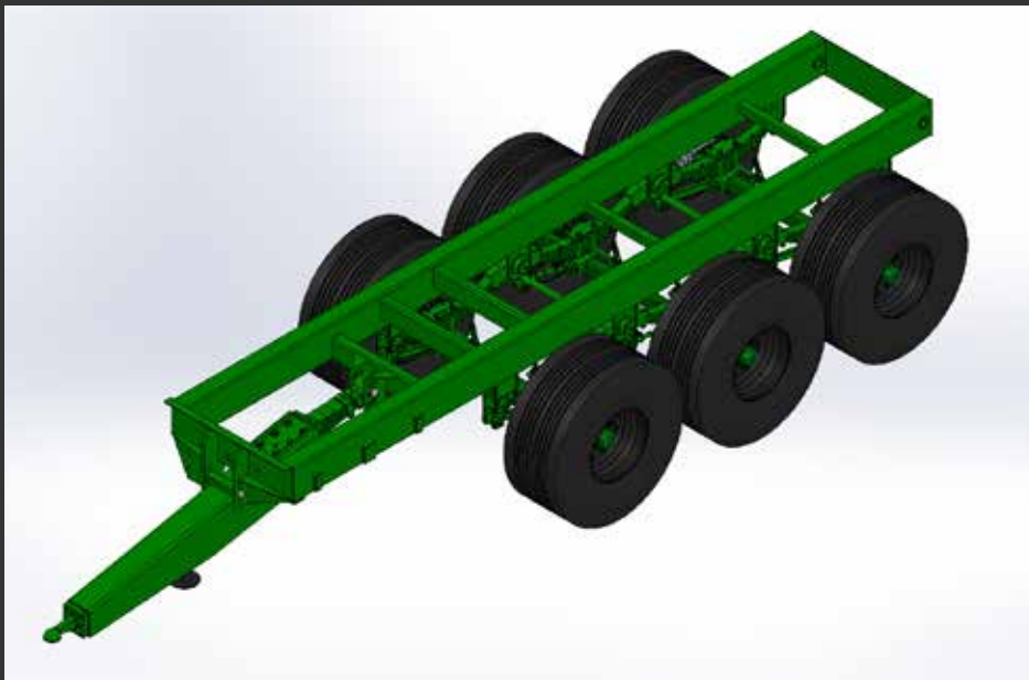
3 ejes trídem tubo estructural Châssis tubulaire 250x150