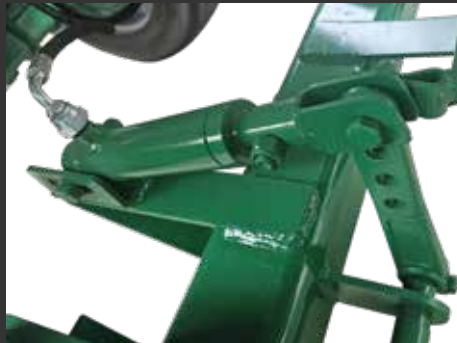
Freno Hidráulico Leva Regulable Frein hydraulique Came réglable