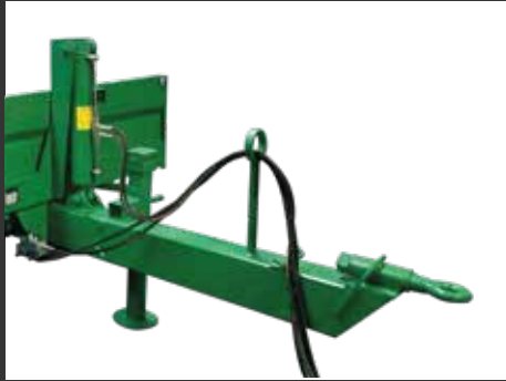
Inclinación hidráulica Basculement hydraulique