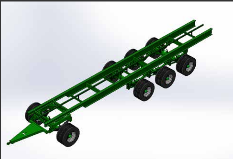
4 ejes giratorio ST52 4 essieux tourelle avant ST52