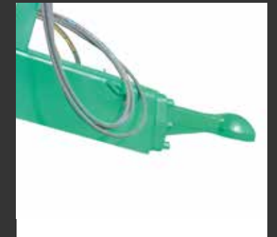
Bola atornillada Crochet de boule vissée