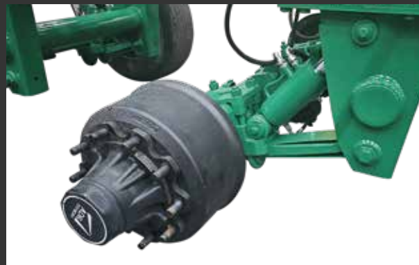
Hidráulica Suspension hydraulique