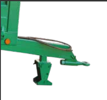
Apoyo fijo Béquille fixe