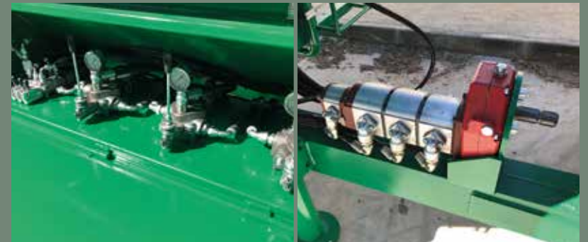
Bombas y mandos hidráulicos / Pompes et commandes hydrauliques