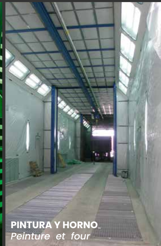
PINTURA Y HORNO Peinture et four