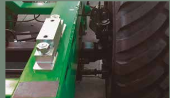
Celulas de pesaje // Cellules de pesage