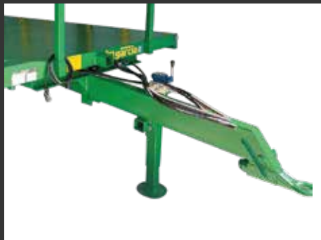
Lanza regulable en altura Flèche réglable en hauteur