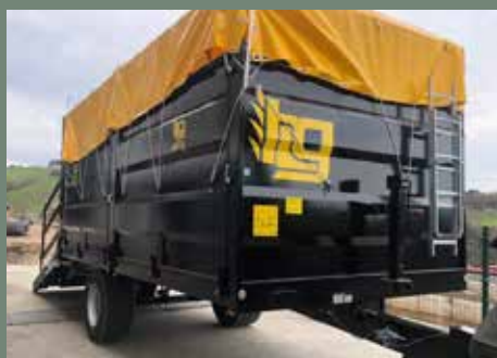
Caja desmontable con rampa / Caisse détachable avec rampe