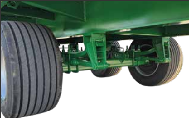
4 ballestas tándem tensores 4 ressorts tandem avec tenseurs