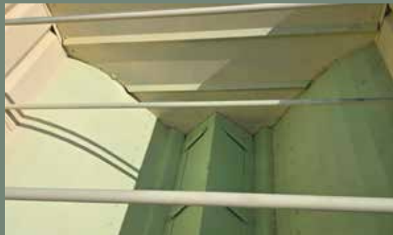
Separación interior // Séparation intérieure