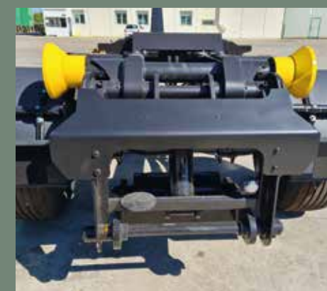
Rodillo trasero hidráulico // Rouleau hydraulique arrière