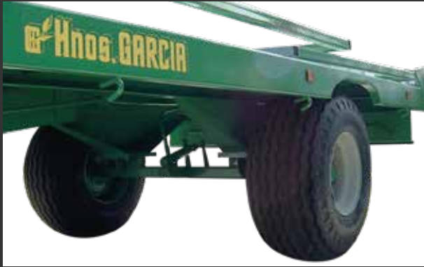
No suspensión Pas de suspension