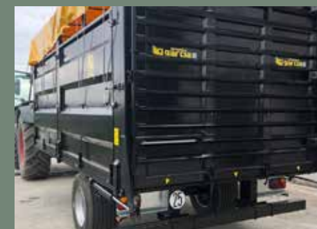
Detalle de rampa / Détail de la rampe