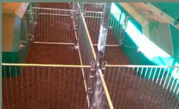
División para cerdos / Division pour cochons