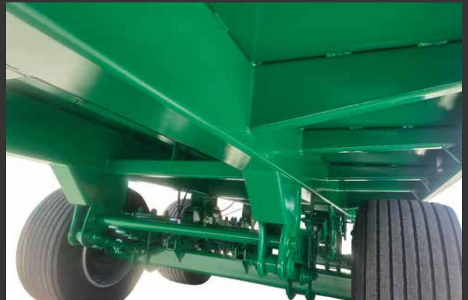
Chassis/bastidor # 250x150 Châssis/cadre # 250x150