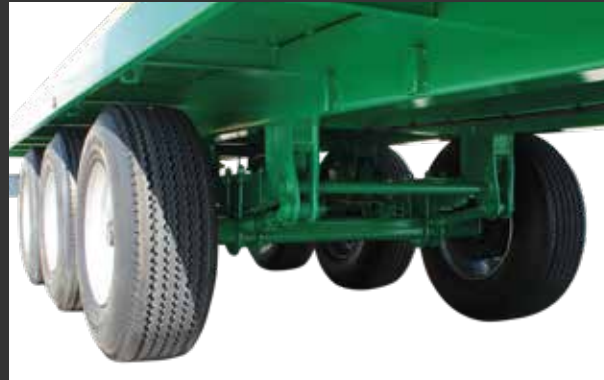
6 ballestas trídem tensores 6 ressorts trídem avec tenseurs