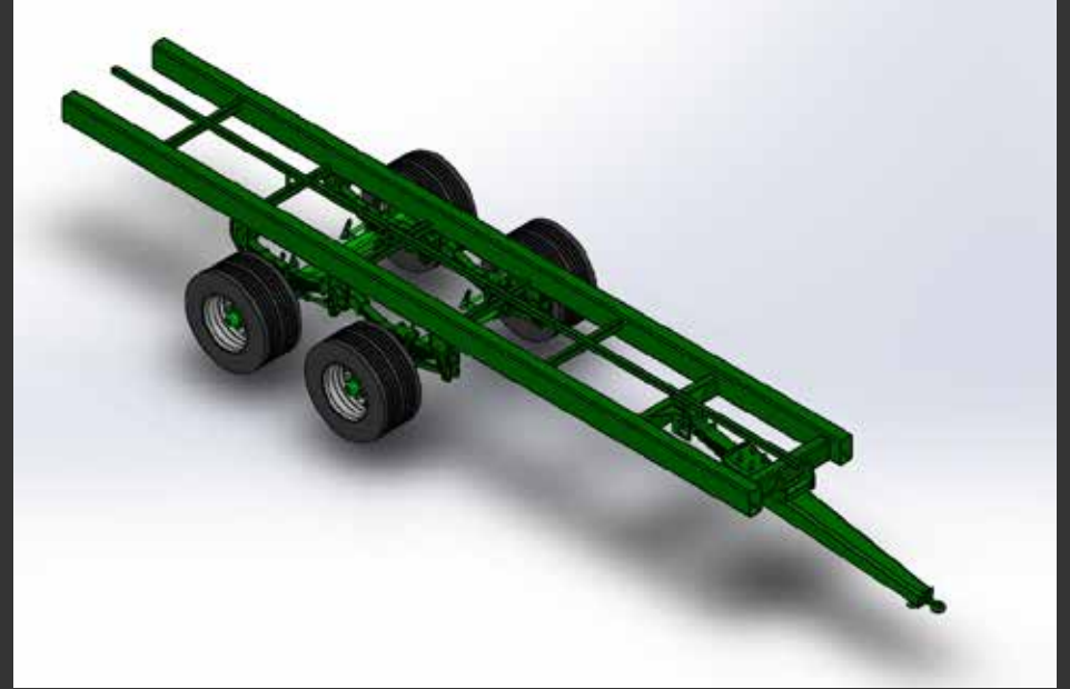
2 ejes tándem tubo estructural 2 essieux tandem châssis en tube structurel