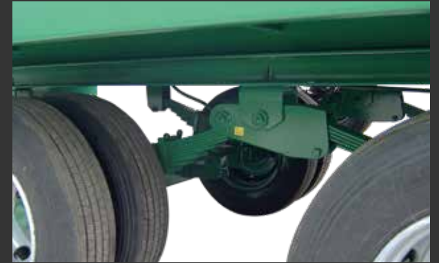
4 ballestas tándem 4 ressorts tandem