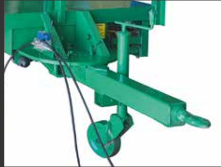
Giro hidráulico Rotation hydraulique