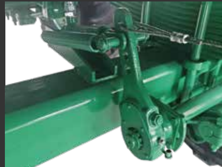
Freno Hidráulico Regulación Automática Frein hydraulique Régulation automatique