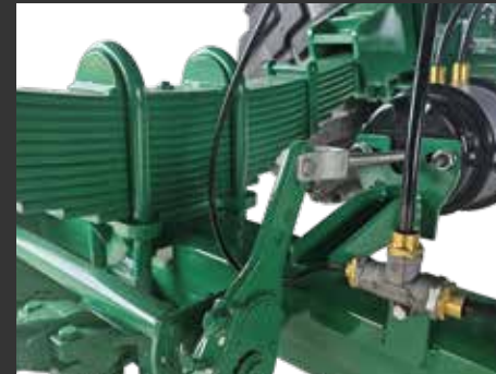
Freno Neumático Frein pneumatique