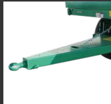
Anilla soldada Anneau soudé